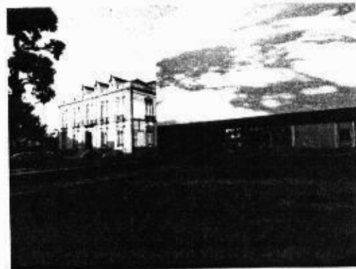
UAç está a cumprir com pagamentos das bolsas